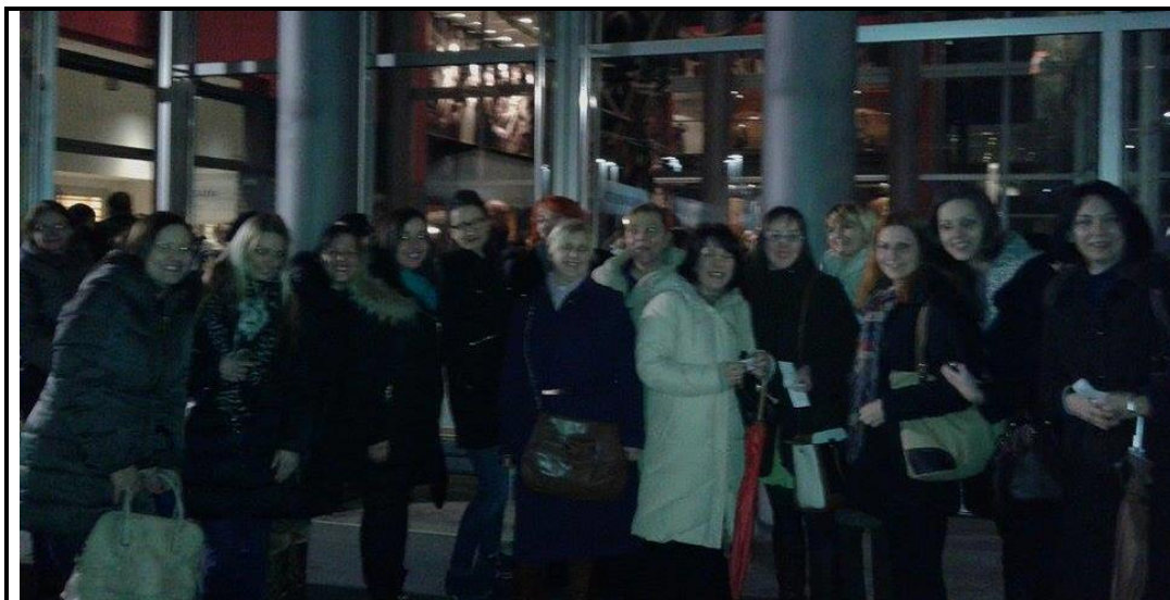
На позоришној представи у ЈДП-у за 8. 03. 2015.

Поводом 8. марта школа је обрадовала све запослене колективним одласком на представу „Шине“ у ЈДП-у.