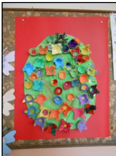
Ускршњи панои у млађим разредима